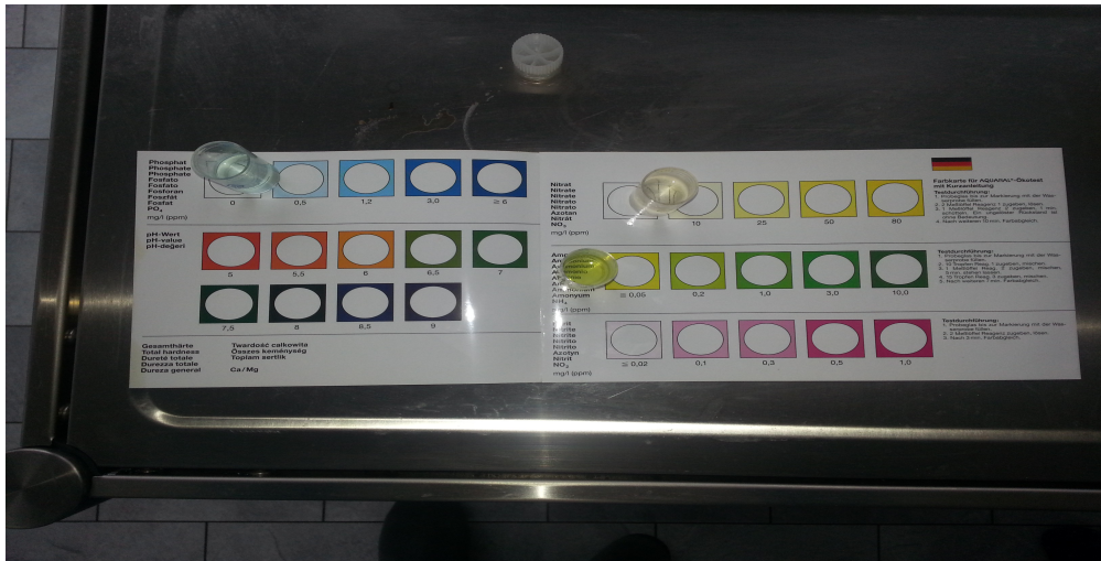
Vålse afvandingskanal 5/4 2014 før kloakering